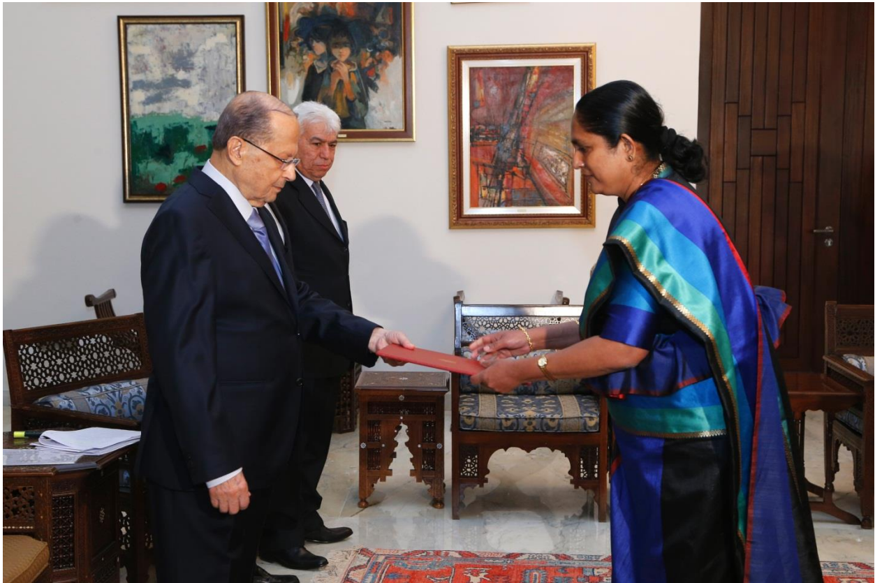
ගරු තානාපතිතුමිය ගරු ජනාධිපතිතුමා වෙත තම අක්තපත්‍ර ප්‍රදානය කරමින්

අක්ත පත්‍ර ප්‍රදානය කිරීමෙන් අනතුරුව ජනාධිපතිතුමා සහ ගරු තානාපතිතුමිය සුභදූ පිළිසඳරක යෙදුන අතර මෂෙල් අවුන් මහතා විසින් ලෙඩනනයේ ආර්ථික ප්‍රවර්ධනය සඳහා ශ්‍රී ලාංකික විගමනික ප්‍රජාවගේ දායකත්වය ඇගයීමට ලක්කරන ලද අතර දෙරට අතර සුභදානා වර්ධනය සඳහා අවශ්‍ය නොමසුරු දායකත්වය ලෙඩනන් රාජ්‍ය මගින් ලබා දෙන බවට එකඟතාවය පල කරන ලදී. පිළිතුරු වශයෙන් තානාපතිතුමිය ශ්‍රී ලංකා ජනාධිපති මෛත්‍රීපාල සිරිසේන මැතිණියගේ සහ අගමැති රනිල් වික්‍රමසිංහ මැතිතුමාගේ උණුසුම් සුභාශිංඡනය ලෙඩනනයේ ජනාධිපතිතුමාට හා ලෙඩනනයේ ජනතාව වෙත ප්‍රදාන කරන ලදී. එම අවස්ථාවේදී එරට තානාපති සම්ප්‍රදායට අනුව යමින් මෂෙල් අවුන් මහතා විසින් දෙරට අතර මිත්‍ර සබඳතාවය වෙනුවෙන් සවිඳිය පුරන ලදී. ඒ සඳහා ස්තූති පුර්වකවෙමින් තානාපතිතුමිය විසින් තම ධුරකාලය තුලදී අනොන්‍ය මත්‍රත්ව සහ සහයෝගතාව මත පදනම් වූ ද්විපාර්ශ්වික සම්බන්ධතාවය වැඩිදියුණු කරගැනීම තම අභිමතාර්ථය බව පළකරන ලදී.