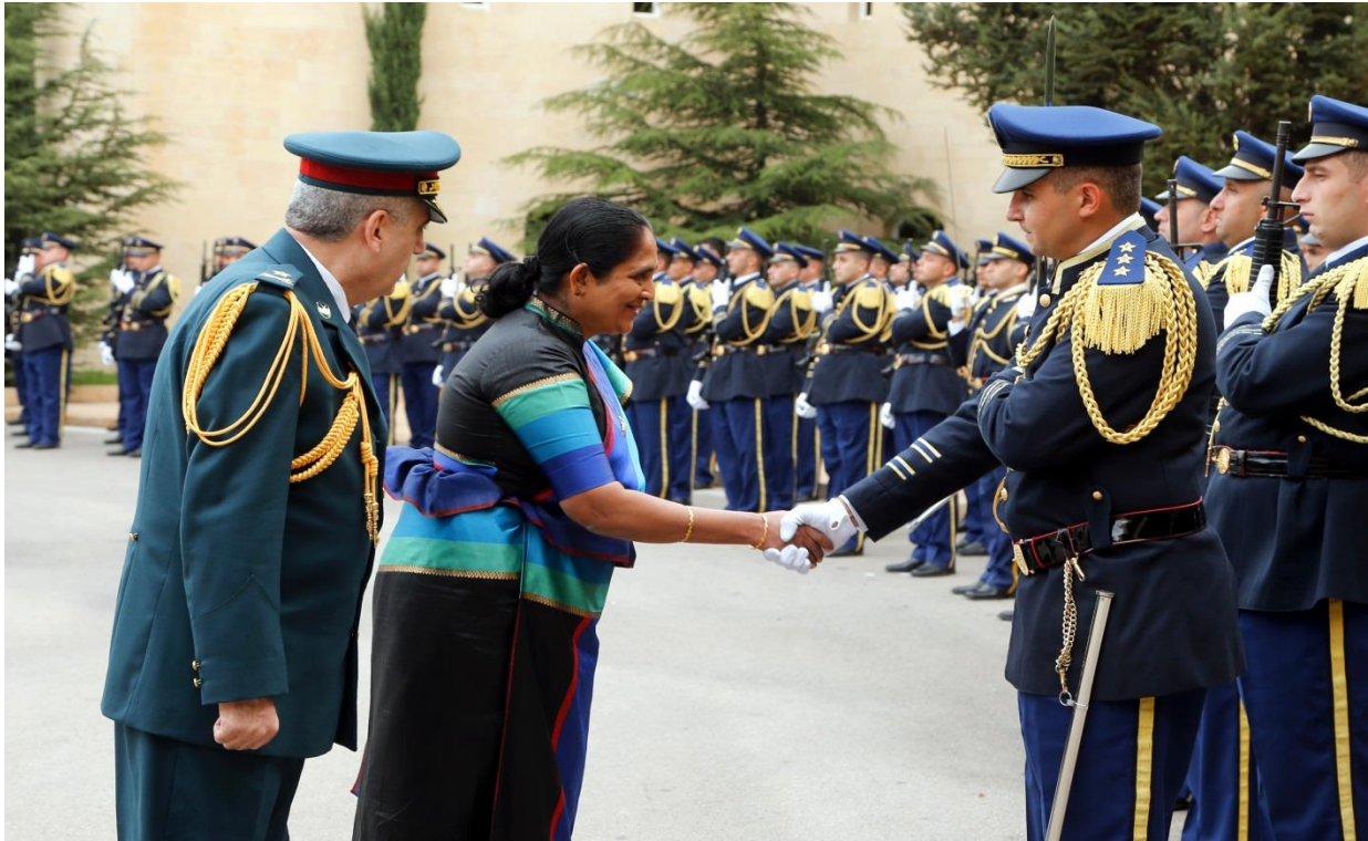
ගරු තානාපතිතුමිය හමුදා උත්තමාවාර පිළිගනිමින්

ශ්‍රී ලංකා ප්‍රජාතාන්ත්‍රික සමාජවාදී ජනරජයේ ලෙබනනයේ නව තානාපතිනිය වශයෙන් රීතිශ්‍රී රක්තියා කුමාරි විජේරත්න මෙන්ඩිස් මැතිණිය ලෙබනන් ජනාධිපති නිළ නිවසේදී (බාබදා මන්දිරය) නව ජනාධිපති ජෙනරාල් මිෂෙල් අවුන් මැතිතුමා වෙත 2016 නොවැම්බර 16 වන දින තම අක්තපත්‍ර ප්‍රදානයකරන ලදී. එතුමිය ශ්‍රී ලංකා රජය විසින් මැදපෙරදිග රාජ්‍යයක් වෙත පත්කරන ලද ප්‍රථම තානාපතිවරියයි.